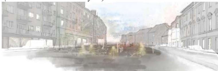
Pav. 13 Konkursinio darbo „STIKLO KAROLIUKAI“ vizualizacija