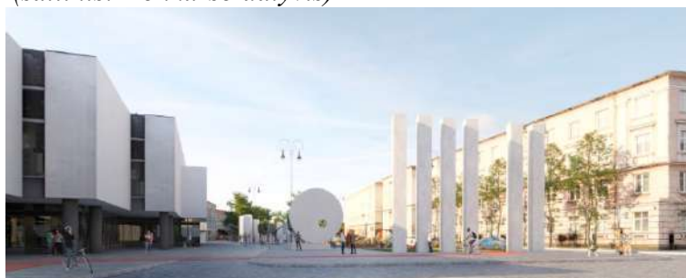
Pav. 7 Konkursinio darbo „GOALKEEPER“ vizualizacija