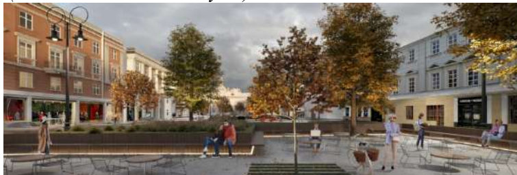
Pav. 9 Konkursinio darbo „URBAN LIVING ROOM“ vizualizacija