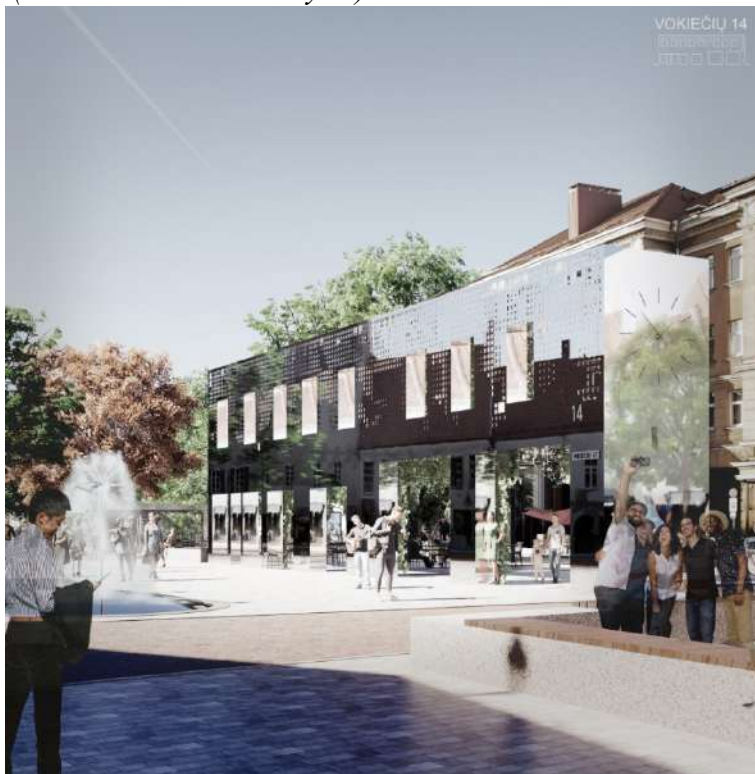
Pav. 8 Konkursinio darbo „VOKIEČIŲ 14“ vizualizacija