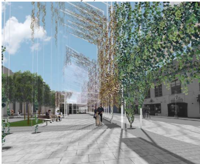
Pav. 20 Konkursinio darbo „HISTORY IN GREEN“ vizualizacija