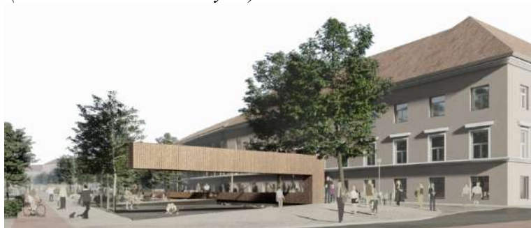
Pav. 17 Konkursinio darbo „SIENNA“ vizualizacija