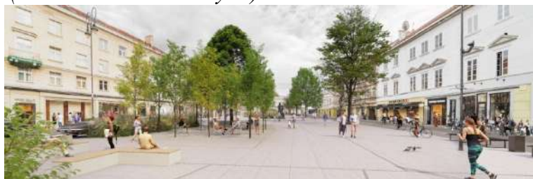
Pav. 4 Konkursinio darbo „STRASSEN-PLATZ“ vizualizacija