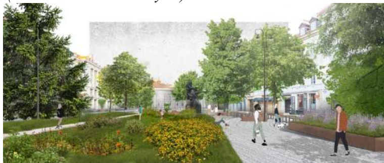
Pav. 18 Konkursinio darbo „RESONANCE“ vizualizacija