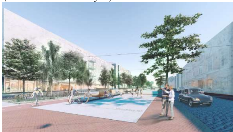
Pav. 6 Konkursinio darbo „PARARELĖS“ vizualizacija