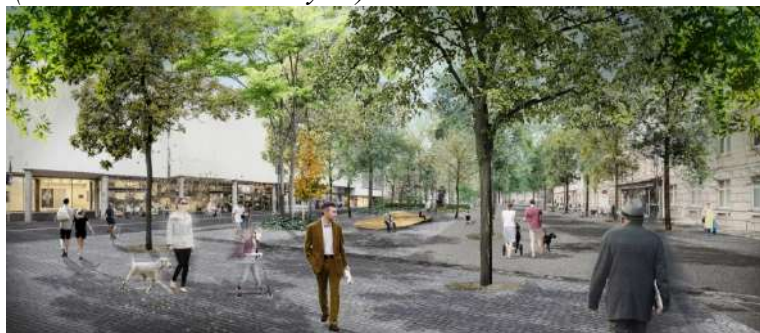
Pav. 12 Konkursinio darbo „OLDTOWN COMMON“ vizualizacija