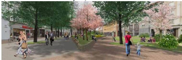
Pav. 16 Konkursinio darbo „OASIS“ vizualizacija