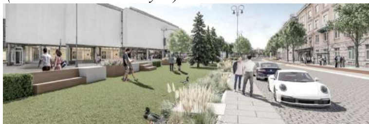
Pav. 5 Konkursinio darbo „WILLKOMMEN“ vizualizacija