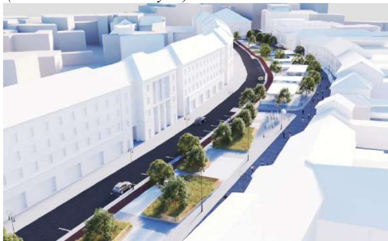
Pav. 10 Konkursinio darbo „URBAN ISLANDS“ vizualizacija