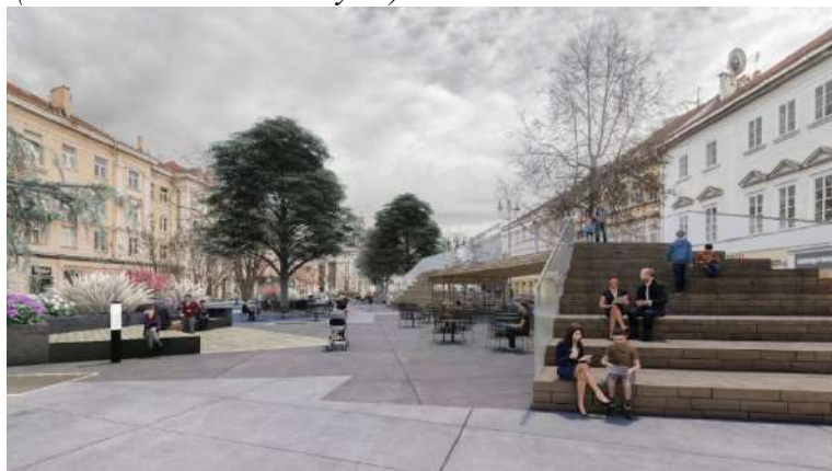
Pav. 14 Konkursinio darbo „VOKIEČIŲ24h“ vizualizacija