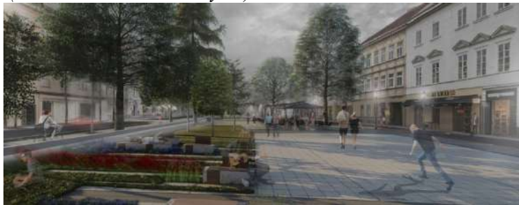
Pav. 15 Konkursinio darbo „LET’S MEET ON THE VOKIEČIŲ STREET“ vizualizacija (šaltinis: Konkurso dalyvis)