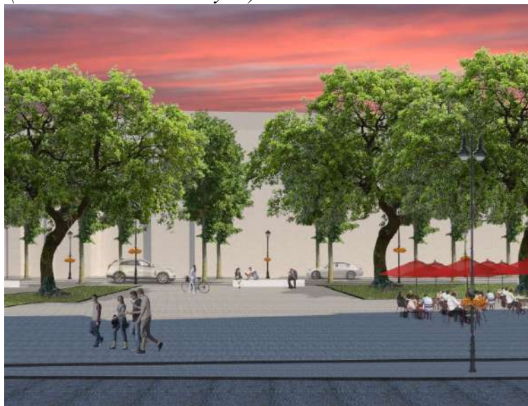
Pav. 21 Konkurso darbo „PLOKŠTUMA“ vizualizacija